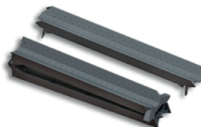
Auf- und Überfahrtschiene (faltbar) (Art. 19950)