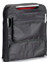
Transport- und Aufbewahrungstasche (Art. 19850)