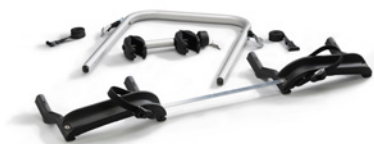
Erweiterungskit für 4.Rad (Art. 19720)