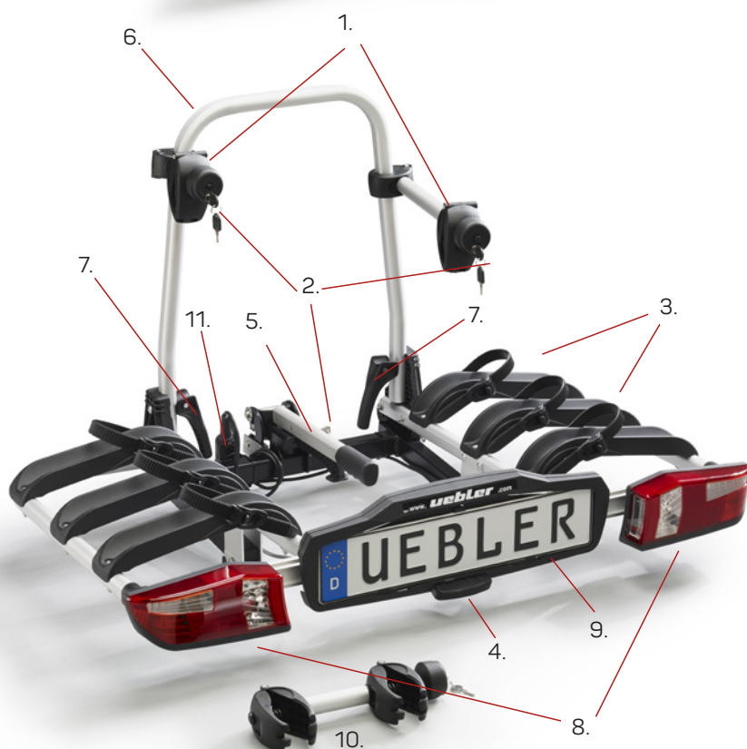
P32 S (Art. 15810)