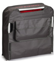
Transport- und Aufbewahrungstasche (Art. 19840)