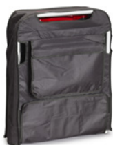
Transport- und Aufbewahrungstasche (Art. 19850)